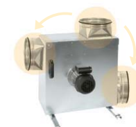
Stabilt hus, solidt udført. Enkel ændring af udløbsretning højre, venstre eller vertikalt.