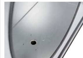
Glat og lækagetæt interiør. Med ¼ afløb (fungerer kun ved vertikal afkast).