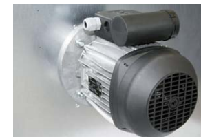
Volt kontrollerbar 230V enkelt fase motor produceret i Vesteuropa.