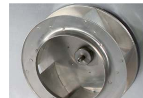
Bagud krummede impeller med høj virkningsgrad, modvirker smuds tilslætning.